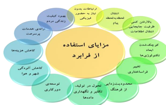
مدل مزایای استفاده از فرابرد

۳- محدودیت زدایی از فرهنگ؛ در این جا افراد یک جامعه،