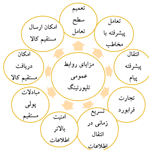
مدل مزایای روابط عمومی تله‌پورتیشنی