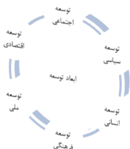
شکل ۱ - معرفی ابعاد توسعه