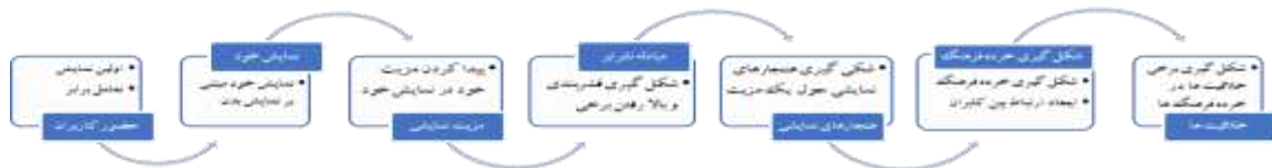
مدل ۱ - خرده فرهنگ