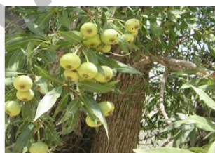
تصویر گونه گلابی وحشی

تیپ بلوط بزرگترین تیپ جنگلی استان کهگیلویه و بویراحمد می‌باشد که مساحتی برابر با ۲۰۰۲۲۵/۵ هکتار (حدود ۲۸ درصد از جنگل‌های استان) را به خود اختصاص داده است. چهار گونه بلوط در منطقه زاگرس وجود دارد که بلوط ایرانی با نام علمی Quercus brantii حدود ۸۵ درصد ترکیب نباتی جنگل‌های بلوط استان کهگیلویه و بویراحمد را با تراکم ۱۸۰ اصله در هکتار و پوشش تاجی حدود ۴۵ درصد در بر می‌گیرد. بنابراین احیا و غنی‌سازی این جنگل‌ها با گونه بلوط ایرانی به عنوان مهم‌ترین گونه چوبی تشکیل‌دهنده یک امر ضروری است (ذوالفقاری، ۱۳۸۷). از گونه‌های درختی و درختچه‌ای استان می‌توان به زالزالک ( Crataegus azarollus )، بنه ( Pistacia atlantica )، کیکم ( Acer cinerascens )، گلابی وحشی ( Pyrus glabra )، بادام وحشی ( Amygdalus erioclada ) و زبان‌گنجشک ( Fraxinus oxycarpa ) اشاره کرد که درصد قابل توجهی از جنگل‌های استان را شامل می‌شوند (شکل ۲).