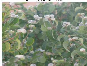
تصویر گونه یلاخود

شکل ۲. تصویر برخی گونه‌های درختی و درختچه‌ای و نمای کلی جنگل‌های بلوط استان کهگیلویه و بویراحمد