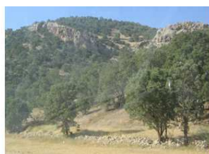
تصویر جنگل‌های بلوط استان