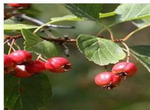
تصویر گونه زالزالک