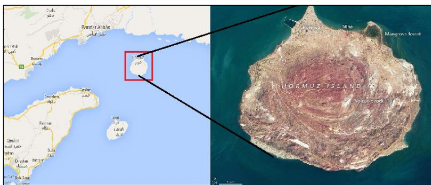
شکل ۱. نقشه و موقعیت جزیره هرمز در خلیج فارس

جزیره هرمز در دهانه تنگه هرمز در مدخل ورودی خلیج فارس از دریای عمان بین مختصات جغرافیایی ۵۶ درجه ۲۵ دقیقه تا ۵۶ درجه و ۳۰ دقیقه طول شرقی و ۲۷ درجه و ۲ دقیقه تا ۲۷ درجه و ۶ دقیقه عرض شمالی واقع شده است. جمعیت جزیره هرمز طبق سرشماری سال ۹۵ برابر با ۵۸۹۱ نفر اعلام شده است (درگاه ملی آمار ایران، ۱۳۹۶). این جزیره با دارا بودن ۴۲ کیلومترمربع مساحت و ۳۸ کیلومتر طول خطوط ساحلی یکی از جزایر مهم ایرانی در منطقه تنگه هرمز محسوب می‌شود و با ۱۸ کیلومتر فاصله با بندرعباس، نزدیک‌ترین جزیره به بندرعباس است (کامران، ۱۳۸۲). این جزیره دارای