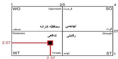
شکل ۲. نتیجه حاصل از ارزیابی عوامل خارجی و داخلی در ماتریس SWOT

بر اساس مقادیر به دست آمده و با توجه به ماتریس SWOT از میان چهار نوع راهبرد ممکن شامل تهاجمی، رقابتی، تدافعی و حفاظتی، استراتژی مطلوب برای مدیریت گردشگری جزیره هرمز استراتژی تدافعی پیشنهاد شد (شکل ۲). سپس با استفاده