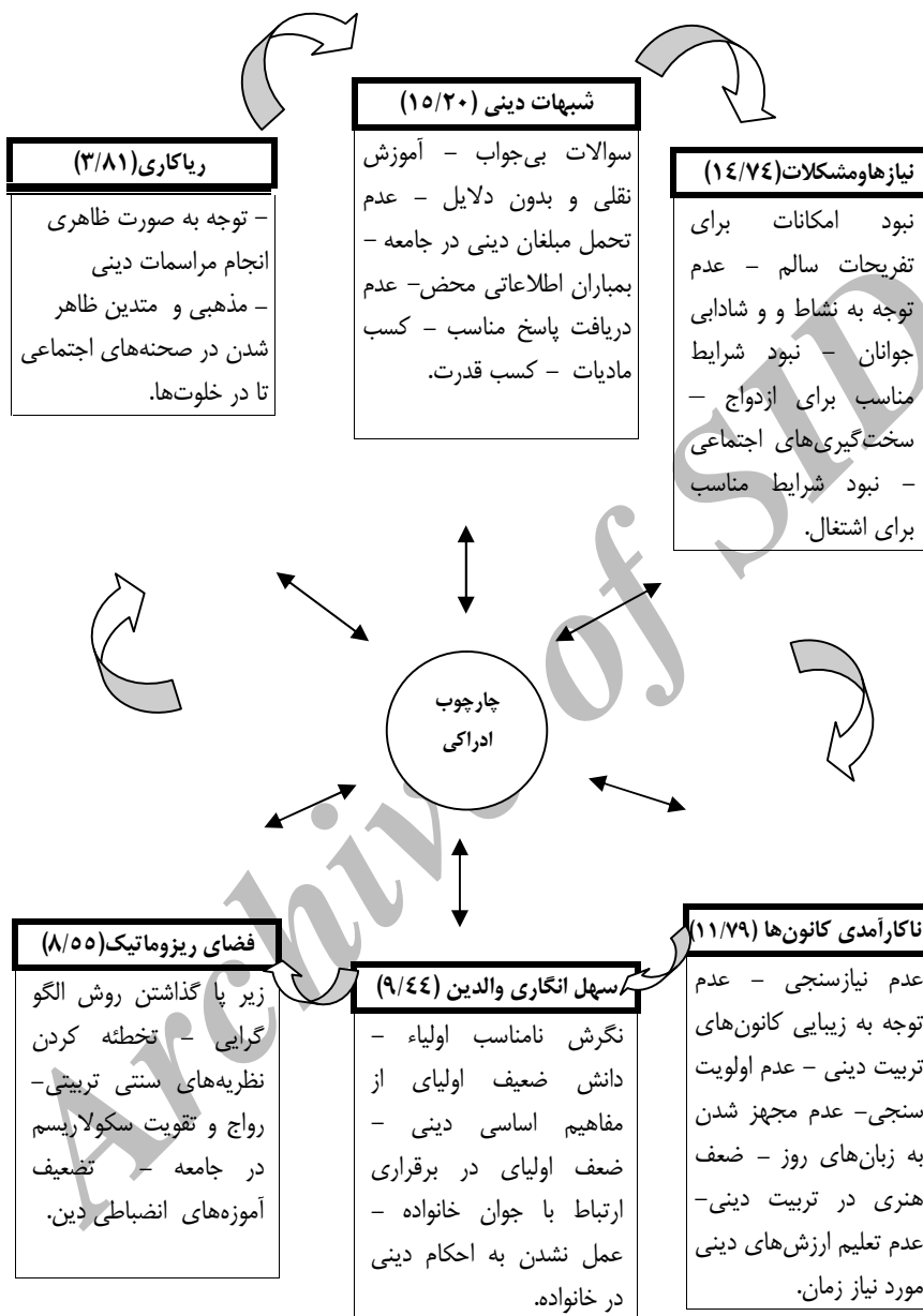
شکل شماره (۱) مربوط به چارچوب ادراکی عوامل آسیب زای تربیت دینی