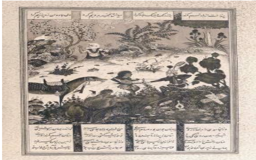
تصویر ۱۰، خوان چهارم کشته شدن زن جادو بر دست اسفندیار