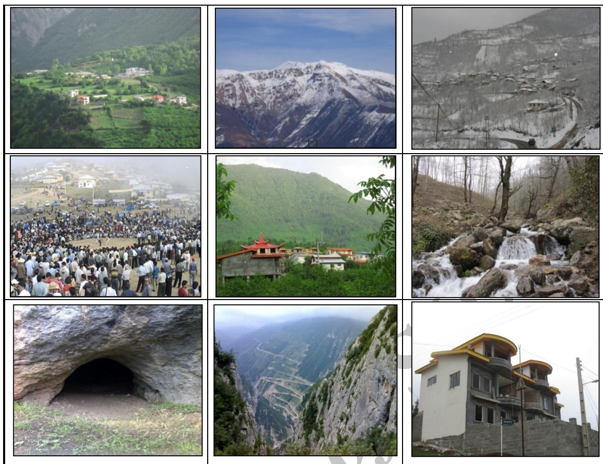
شکل ۲. انواع جاذبه‌های گردشگری ناحیه اشکورات