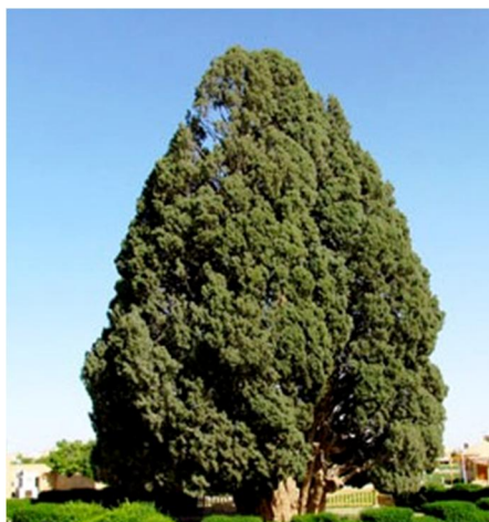
تصویر شماره ۱: سرو اول ابرکوه

سرو ابرکوه گرچه کهنسال‌ترین موجود زنده دنیاست و طول عمر آن حداقل ۴۵۰۰ سال است، قطر تنه بیش از ۳ متر و قطر تاج بیش از ۱۴ متر می‌باشد. ارتفاع این سرو ۲۵ متر است، تصویر شماره (۱) سرو اول را نشان می‌دهد.