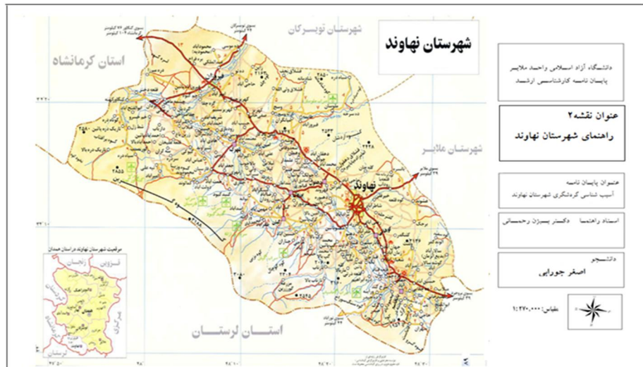
نقشه ۲: راهنمای شهرستان نهاوند