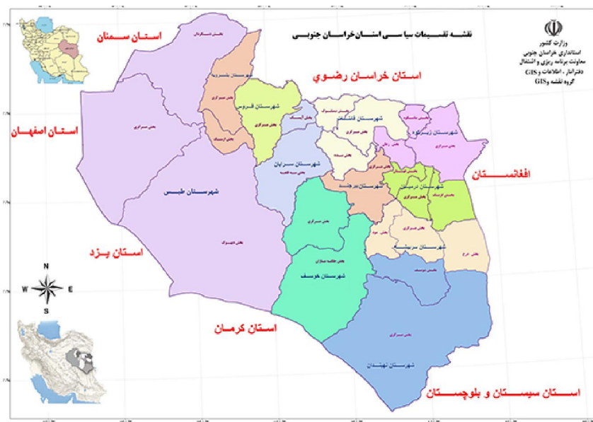
شکل (۲): موقعیت استان خراسان جنوبی در کشور

از لحاظ جاذبه‌های گردشگری، استان خراسان جنوبی، در مسیر محورهای ارتباطی استان‌های جنوبی ایران با مشهد قرار دارد. محور اصلی ارتباطی استان‌های یزد، کرمان، اصفهان، فارس، بوشهر و هرمزگان به مشهد، از طبس، بشرویه و فردوس می‌گذرد. همچنین محور ارتباطی استان سیستان و بلوچستان به مشهد از شهرهای نهبندان، سریشه، بیرجند و قائن عبور می‌کند. یکی از قدیمی‌ترین جاذبه‌های گردشگری ثبت شده در استان خراسان جنوبی سنگ نگاره کال جنگال در ۵ کیلومتری جنوب شهر خوسف و متعلق به دوره اشکانی است که در بررسی‌های جدید ۱۴ سنگ نگاره در نزدیکی آن شناسایی شده است. از دیگر جاذبه‌های گردشگری استان می‌توان به ژئوتوریسم و جاذبه‌های کویری، روستاهای هدف و مناطق نمونه گردشگری استان و مجتمع‌های آبدرمانی اشاره کرد (جدول ۱). (اداره کل میراث فرهنگی و صنایع دستی و گردشگری خراسان جنوبی). همچنین در این استان میراث فرهنگی، معنوی و طبیعی وجود دارد که جزء آثار ملی به ثبت رسیده است.