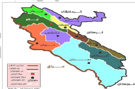
نگاره ۱. موقعیت شهرستان ایلام در سطح استان ایلام

حیدرآباد در دل دهستان میش خاص و در ناحیه جنوب غرب شهرستان ایلام قرار گرفته است. روستای حیدرآباد از ۳۰ کیلومتری شهر ایلام شروع شده و تا ارتفاعات طولاب در نزدیکی روستا امتداد دارد. آمیختگی جنگل و باغ‌های میوه، به خصوص درختان گردو، همراه با چشمه‌ها و رودهای خروشان، چشم‌اندازی زیبا به این دره بیلاقی بخشیده است. این دره هم از نظر جذب گردشگر و هم از نظر تولید محصولات باغی، از جمله منابع درآمدزا و مهم استان و روستاییان به شمار می‌آید. بافت این روستا نکات جالب توجهی دارد، چون در این روستا کوچه‌بندی شده و هر کوچه یک اسم دارد و موزاییک شدن کوه‌ها و تمیزی روستا نشان می‌دهد طرح هادی تا حدود زیادی در روستا اجرا شده است. در این روستا، ایستگاه مطبوعاتی، سطل زباله‌های مخصوص، سرویس بهداشتی، آب سرد کن و... وجود دارد و این روستا از جمله مناطق استان ایلام است که مردم در توسعه و اجرای طرح‌های مختلف آن مشارکت فعال دارند و هر ساله در دهه سوم خرداد، جشن برداشت زردآلود در این روستا برگزار می‌شود. در این جشن بهترین محصول و باغدار نمونه معرفی می‌شود. روستای کوهستانی حیدرآباد ۱۴۰۰ متر از سطح دریا ارتفاع دارد و اقلیم آن معتدل و کوهستانی است و در فصول بهار و تابستان و اوائل پاییز، هوایی معتدل و در زمستان هوایی سرد دارد. روستای حیدرآباد با داشتن طبیعت زیبا و ظرفیت‌های بالقوه طبیعی فراوان به عنوان یکی از قطب‌های اصلی گردشگری به شمار می‌رود. همچنین منطقه مورد مطالعه دارای جاذبه‌های طبیعی همچون چشمه‌ها، باغات میوه، زمین‌های کشاورزی مستعد، تپه و دشت‌های سرسبز، اردوگاه تفریحی، گیاهان دارویی، بافت معماری سنتی و ... می‌باشد.