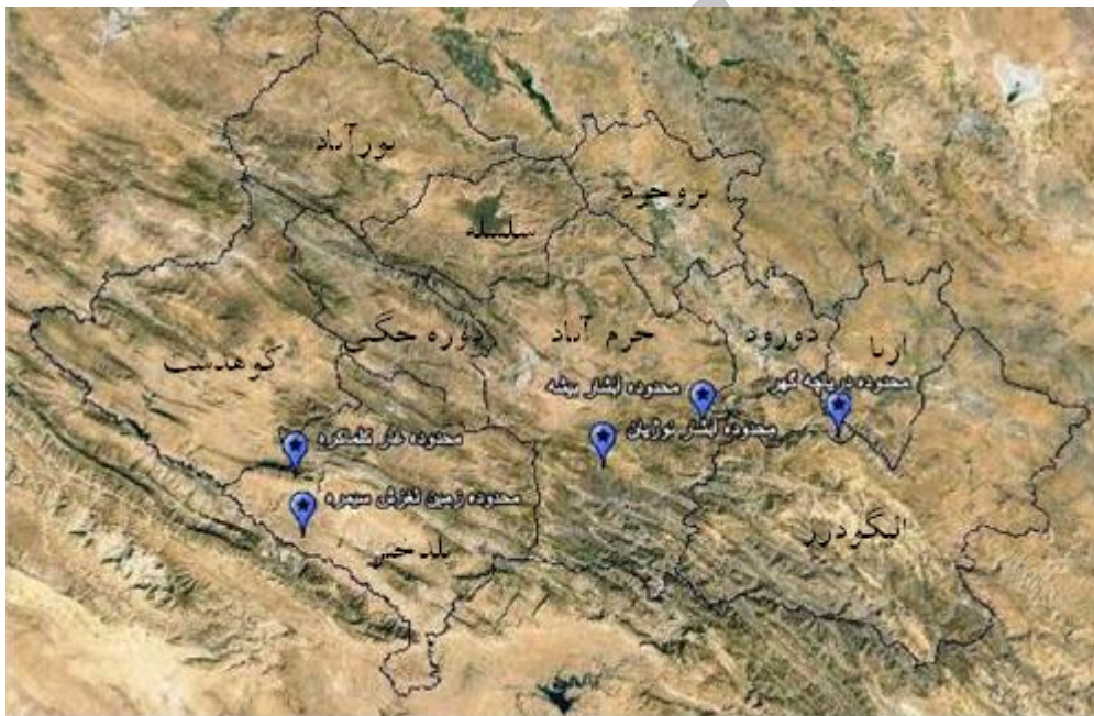
شکل ۲: محدوده‌های پیشنهادی جهت معرفی به عنوان ژئوپارک جهت معرفی در استان لرستان

در بخش پائینی ساختار سلسله مراتبی، گزینه‌های پیشنهادی جهت تعیین محدوده ژئوپارک قرار دارد. این گزینه‌های با توجه به ویژگی‌های زمین شناختی و جنبه‌های زیباشناختی آن، از میان جاذبه‌های فراوان ژئوتوریستی در استان لرستان انتخاب شده‌اند. محدوده‌های مورد نظر علاوه بر اینکه دارای جنبه‌های ژئومورفولوژیک و زمین شناختی می‌باشند، با مرکزیت قرار دادن یک جاذبه شاخص ژئوتوریستی، جذابیت دو چندانی یافته است. از میان گزینه‌های موجود ژئوتوریستی، با توجه به اهمیت آن‌ها و میزان جذابیتی که دارند، ۵ گزینه به عنوان گزینه‌های نهایی احداث ژئوپارک در استان لرستان انتخاب شدند (شکل ۲). لازم به ذکر است که دره شیرز براساس مطالعه یاراحمدی و شرفی (۱۳۹۳) به تنهایی نمی‌تواند به عنوان ژئوپارک معرفی شود، بنابراین در این تحقیق به عنوان یکی از گزینه‌های پیشنهادی در نظر گرفته نشده است.