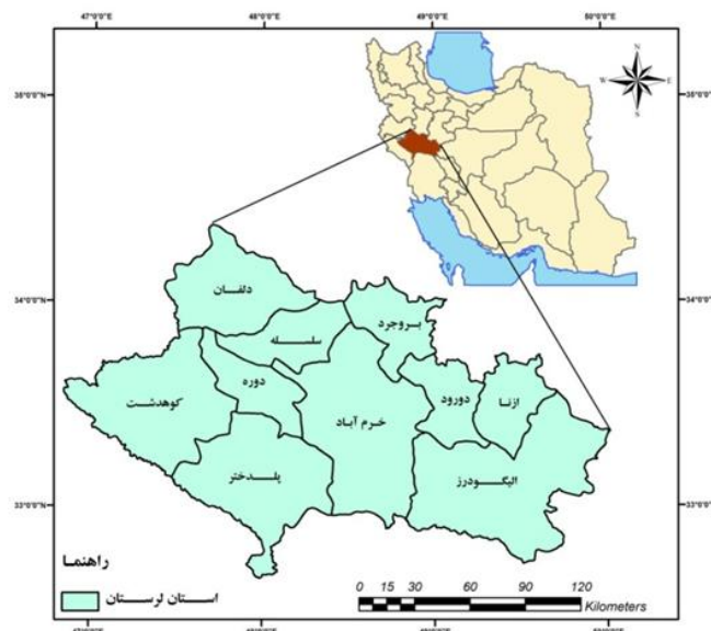
شکل ۱: موقعیت محدوده مورد مطالعه