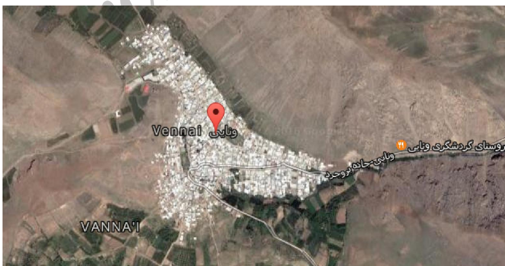
تصویر شماره ۱- موقعیت روستای ونایی