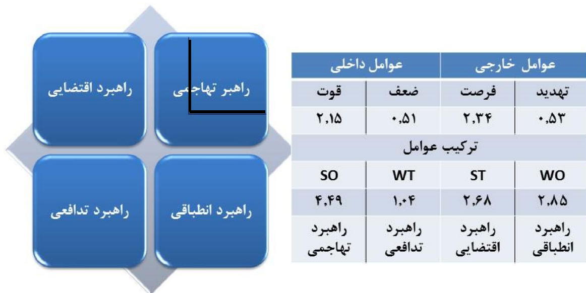
شکل ۱- تعیین راهبرد مطلوب توسعه پایدار گردشگری و ترکیب آن (مأخذ: یافته‌های پژوهش، ۱۳۹۵).

تجزیه و تحلیل عوامل درونی (قوت‌ها و ضعف‌ها) و عوامل بیرونی (فرصت‌ها و تهدیدها) حاکی از این است که راهبرد تهاجمی (حداکثر-حداکثر)، با امتیاز ۴/۴۹ به‌عنوان مهم‌ترین راهبرد توسعه پایدار گردشگری در این روستا مطرح می‌باشد. راهبردهای انطباقی (حداقل-حداکثر)، اقتضایی (حداکثر-حداقل) و تدافعی (حداقل-حداقل)، به ترتیب با امتیاز نهایی ۲/۲، ۶۸/۸۵، ۱/۰۴ در رده‌های بعدی قرار دارند. در ادامه، مهم‌ترین موارد در هر راهبرد برای توسعه و پیشبرد موضوع مورد بحث در زمینه به‌کارگیری توسعه پایدار گردشگری در روستای ونایی بیان می‌گردد.