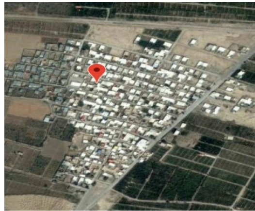
شکل شماره ۱: نقشه ماهواره‌ای روستای قردين