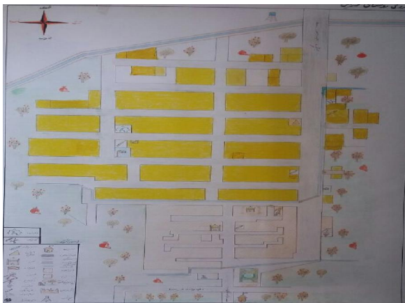
شکل شماره ۲: شماتیک روستای قردين

قردين در 37^{\circ} ، 17' ، 50'' تا 36^{\circ} ، 29' ، 50'' شرقی و 34^{\circ} ، 24' ، 56'' تا 34^{\circ} ، 00' ، 36'' شمالی در ۱۰ كيلومتری جنوب ساوه و ۱۲۵ كيلومتری جنوب غربی تهران در بخش مرکزی، در دهستان نوعلی بیگ شهرستان ساوه به امر کیخسرو ساخته شده است. آورده‌اند چون به کوه اندیس و ماهین رسید دستور به ساخت بنا داد و چون به اوامر خود گفت: "کردید این" به مرور زمان به قردين تغییر نام یافته است (قمی، ۱۳۶۱: ۸۱) (شکل شماره ۱ و ۲).