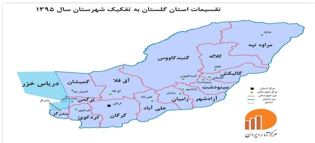
شکل ۱-

استان گلستان با مساحت حدود ۲۰۳۶۷ کیلومتر مربع بین ۳۶ درجه و ۲۵ دقیقه تا ۳۸ درجه و ۸ دقیقه عرض شمالی از استوا و ۵۳ درجه و ۵۰ دقیقه تا ۵۶ درجه و ۱۱ دقیقه طول شرقی از نصف النهار گرینویچ قرار گرفته است. مساحت آن بیشتر از ۷۰ کشور جهان و ۱۰ استان دیگر کشور می‌باشد. این استان از شمال به جمهوری ترکمنستان از شرق به استان خراسان از جنوب به استان سمنان و از غرب به استان و دریای مازندران محدود می‌شود. بر اساس آخرین تقسیمات اداری و سیاسی کشور استان گلستان از ۱۴ شهرستان ۲۹ شهر ۲۷ بخش ۶۰ دهستان تشکیل شده است (سایت مرکز آمار ایران، ۱۳۹۵). در استان گلستان به دلیل ساختار طبیعی خاص آن و موقعیت جغرافیایی ویژه‌ای که دارد عوامل اقلیمی-توپوگرافی-پوشش انبوه جنگلی-چشم‌انداز- و قابلیت‌های ویژه طبیعی نقش برجسته‌ای در منطقه بندی قطب‌های گردشگری ایفا می‌کنند. بدیهی است راه‌های ارتباطی نیز که اصلی‌ترین وسیله دسترسی به جاذبه‌های گردشگری هستند از اهمیت به سزایی برخوردارند. علی‌هذا با توجه به امکانات و پتانسیل‌های طبیعی فرهنگی استان که در حد امکان ارائه شد، می‌توان استان گلستان را در یک تقسیم بندی اولیه به ۴ کلان حوزه‌ی گردشگری ساحلی-جلگه‌ای-جنگلی و کوهستانی و ارتفاعات تقسیم کرد (شاهکویی، ۱۳۹۰: ۵۶-۵۵).