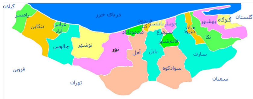
نقشه شماره ۱: نقشه استان مازندران به تفکیک شهرستان

شهرستان نور در سال‌های نه‌چندان دور با نام سولده بخشی از شهرستان آمل بوده است. این شهرستان پس از جدا شدن از آمل دارای سه بخش مرکزی، بلده و چمستان می‌باشد. بخش مرکزی شهرستان نور شامل شهرهای نور (مرکز شهرستان)، رویان (علمده) و ایزدشهر می‌باشد. بخش بلده نیز به مرکزیت شهری قدیمی به همین نام در ۸۵ کیلومتری جنوب شهر نور قرار دارد و پل ارتباطی میان دو جاده مهم هراز و چالوس است.