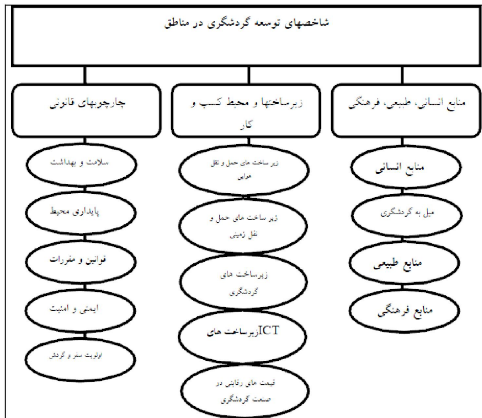
شکل ۲- خلاصه ساختار فهرست شاخص‌ها (کریم‌زاده و همکاران، ۱۳۹۳: ۲۷۴)

۱۷- بخش سازمان‌های کشوری (WTO, 2009). مطابق این طبقه‌بندی نزدیک ۲۰۰ نوع شغل به صورت مستقل، با صنعت گردشگری ارتباط مستقیم دارند. بنابراین ایجاد فرصت‌های شغلی از سوی صنعت گردشگری بسیار حائز اهمیت است، به طوری که در حال حاضر در سطح جهانی حدود یک سوم مشاغل خدماتی به صورت مستقیم و غیرمستقیم در اختیار صنعت گردشگری می‌باشد. لذا هر کدام از این فعالیت‌ها در بخش گردشگری به عنوان فرصت کارآفرینی می‌تواند مطرح باشد. مجمع توسعه اقتصادی سازمان ملل سه شاخص عمده‌ای که منجر به توسعه کارآفرینی در بخش گردشگری مناطق می‌گردد را به این صورت طبقه‌بندی کرده است: (۱) منابع انسانی، فرهنگی و منابع طبیعی مربوط به گردشگری؛ (۲) زیرساخت‌ها و کسب و کار؛ (۳) چارچوب قانونی و نظارتی مربوط به گردشگری (شکل ۲).