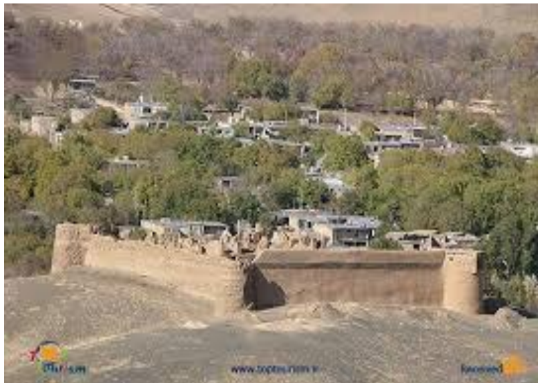
شکل ۴ قلعه اشتران در شهر تویسرکان

از آثار قدیمی دیگر در شهرستان تویسرکان، قلعه‌های قدیمی است. تاکنون ۸ قلعه قدیمی در این شهرستان شناسایی شده است که از بین آنها قلعه اشتران و (اردلان) در سال ۱۳۸۳ به ثبت رسیده است. این قلعه، قلعه‌ای نظامی بوده که در مجاورت روستای اشتران و ۱۸ کیلومتری شهر تویسرکان قرار گرفته است. این قلعه مشرف به قلعه خان گرمز و در مسیر جاده قدیمی همدان - تویسرکان بنا شده است که با وجود گذشت زمان هنوز هم تا حدودی پا برجاست.