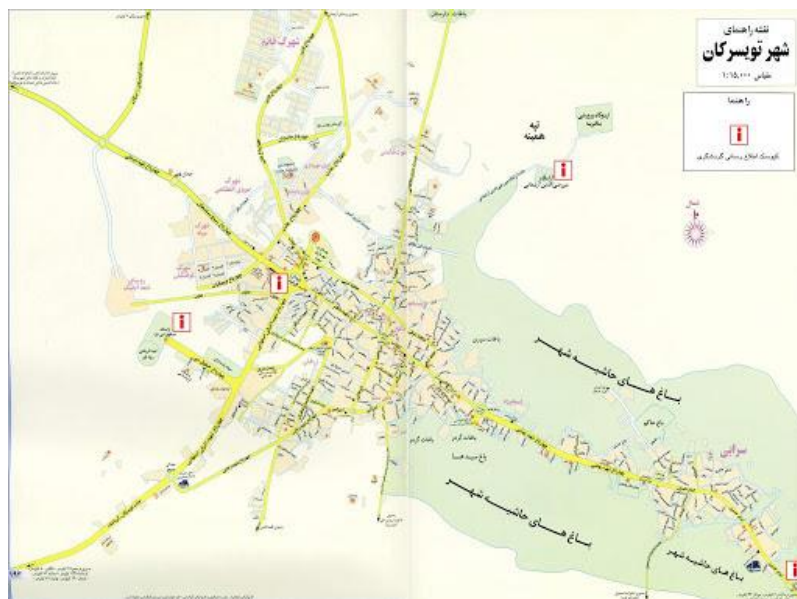
شکل ۲: نقشه مراکز گردشگری شهر توپسرکان

از نظر تقسیمات کشوری مصوب سال ۱۳۲۶ هجری شمسی از بخشهای تابعه شهرستان ملایر در استان پنجم کشور بود که در سال ۱۳۲۸ هجری شمسی از ملایر منفک و به شهرستان ارتقاء یافت. یکی از محبوب‌ترین محصولات توپسرکان گردو است و درخت‌های گردو زیادی در این شهر دیده می‌شود