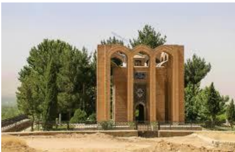
شکل ۶ آرامگاه میر رضی آرتیمانی