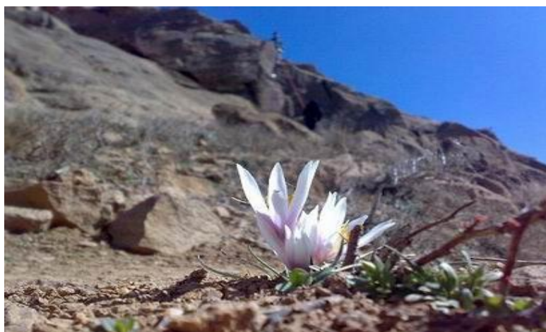
شکل ۳: دامنه‌های شمالی و جنوبی الوند منبع: نگارنده

در دامنه‌های شمالی الوند دره‌های پر آبی مانند: دره برفین، دره گنجنامه، دره عباس آباد، دوزخ دره، دره گوساله، دره کیوارستان، دره سیمین دره، دره مراد بیگ، دره دیوین، دره قز، دره حیدریه و غیره وجود دارد و دره‌های مصفایی نیز در دامنه جنوبی الوند واقع است، از جمله دره سرکان، دره آرتیمانی، دره فاران، دره گزندر، دره شهرستانه و غیره.