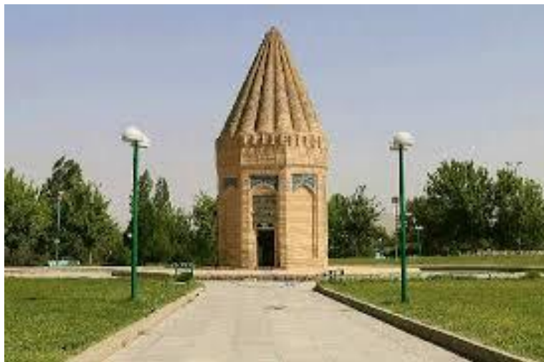
شکل ۵ مقبره حقیوق نبی در توسیرکان