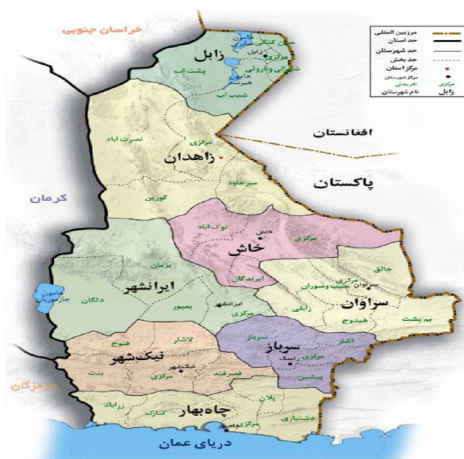
نقشه شماره ۱: شهرهای استان سیستان و بلوچستان

سیستان و زابل امروزی به قسمت شمالی استان سیستان و بلوچستان اطلاق می‌شود. آثار به دست آمده از خرابه‌های شهر سوخته در ۵۵ کیلومتری جاده زابل به زاهدان قدمت فرهنگ و تمدن را در این سرزمین به ۳۲۰۰ ق.م می‌رساند. خرابه‌های کاخ‌های هخامنشی در کوه خواجه و دهانه غلامان و خرابه‌های آتشکده کرکویه و ده‌ها آثار باستانی باقی مانده سیستان را به بهشت باستان‌شناسان تبدیل کرده است. (تاریخ سیستان، ۱۳۱۵: ۱۰۰).