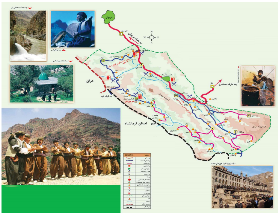
شکل ۲: نقشه گردشگری اورامانات