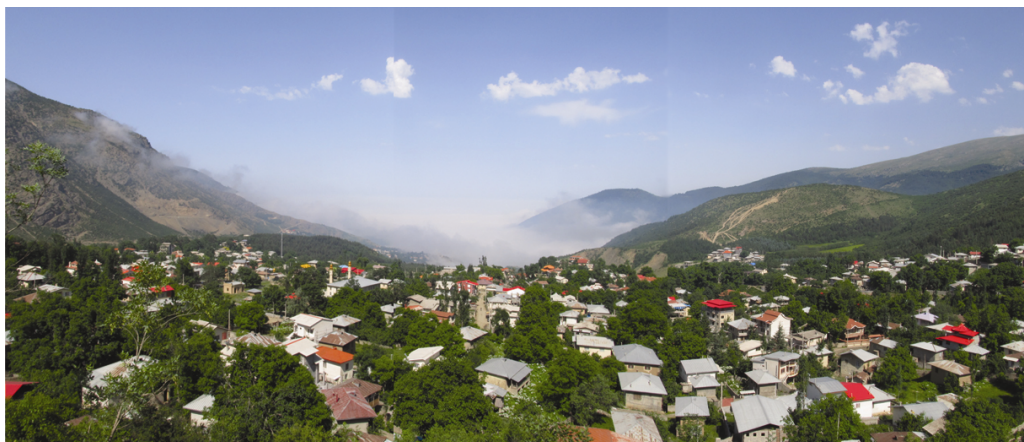
شکل ۲: روستای جواهرده (۱۳۹۱)

در مورد نام این روستا عقاید مختلفی وجود دارد. برخی آن را "جورده" به معنی ده بالا و مرتفع ترین روستای کوهستان برشمرده اند، عده ای آن را به دلیل به دست آمدن آثار قیمتی، طلا و جواهرات در حفاری های به عمل آمده در گذشته "جواهرده" می نامند. جورده واژه ای است مرکب از جور+ ده که در