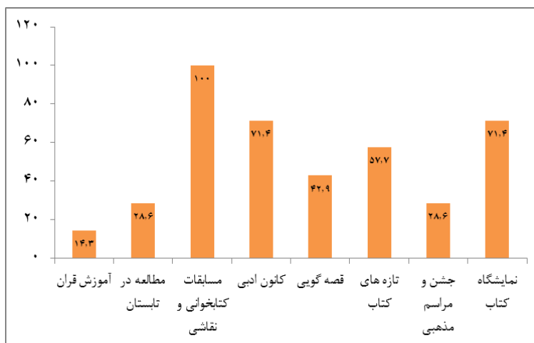
نمودار ۱. درصد فراوانی انواع خدمات جنبی در کتابخانه‌ها