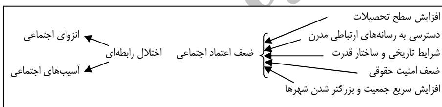
شکل (۲): مدل مفهومی سرمایه اجتماعی و آسیب اجتماعی

شناسایی میزان و فرایند سرمایه اجتماعی در میان مردم جامعه می‌تواند به شناسایی روند تحولات اجتماعی و فرهنگی آن جامعه کمک زیادی بکند و نیز با مطالعه و شناخت دقیق سرمایه اجتماعی در میان اقشار اجتماعی مختلف می‌توان از این مفهوم و شاخص معتبر آن اعتماد اجتماعی در تحلیل مسائل اجتماعی و فرهنگی مانند انسجام اجتماعی، نظم اجتماعی، مشارکت اجتماعی و تقویت نهادهای مدنی به عنوان متغیر پیش‌بینی کننده بهره گرفت. آگاهی از این روند می‌تواند به برنامه‌ریزی اجتماعی و فرهنگی در انتخاب سیاست‌های اجتماعی و مدیریت اجتماعی و همچنین پیشگیری از آسیب‌های اجتماعی کمک شایانی بکند. این مطالعه جنبه توصیفی و تحلیلی دارد و منابع مورد استفاده در گردآوری اطلاعات عبارت از مطالعات کتابخانه‌ای و اسنادی و تحلیل داده‌های موجود است. سوال اصلی این بررسی این است: چه رابطه‌ای بین میزان آسیب‌های اجتماعی و سرمایه اجتماعی وجود دارد؟ فرضیه اصلی این مطالعه این است که بین سرمایه اجتماعی و میزان آسیب‌های اجتماعی در یک جامعه رابطه‌ای وجود دارد. هر قدر میزان سرمایه اجتماعی (اعتماد اجتماعی) یک جامعه کمتر باشد، میزان وقوع آسیب‌های اجتماعی نیز در جامعه بیشتر خواهد بود. مدل تحلیلی و مفهومی در شکل زیر ارائه شده است: