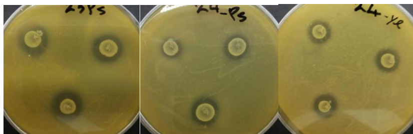
شکل (۱) - قطر هاله عدم رشد باکتری‌های شاخص در پیرامون پرگنه‌های انتروکوکوس

گونه‌های فکالیس، ماندتی، گالیناروم، ساکارولیتیکوس، رافینوسوس، هایرا و آویوم قرار داشتند (نمودار ۱).