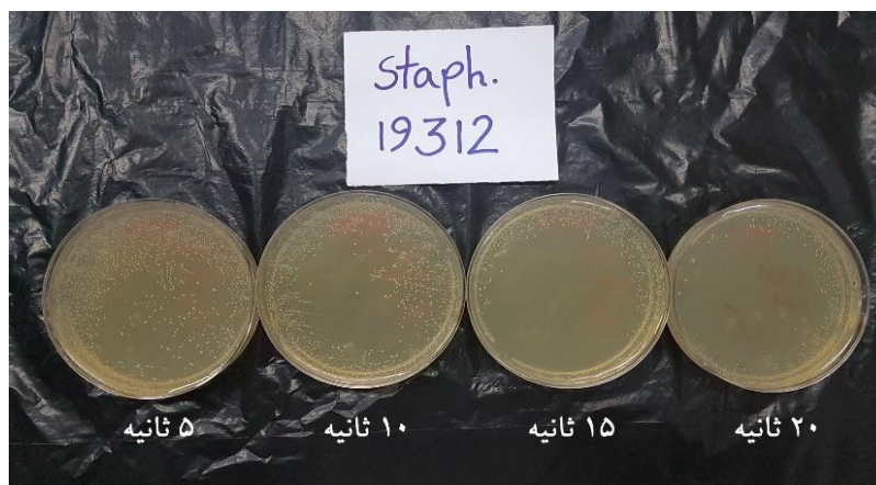
شکل (۳)- اثر پلاسمای سرد اتمسفری بر روی رشد باکتری استافیلوکوکوس اورئوس در زمان‌های مختلف

قرارگیری جدایه‌ها با پلاسمای سرد اتمسفری در سطح احتمالی یک درصد به‌طور معنی‌داری ( p < 0/05 ) باعث کاهش تولید بیوفیلم می‌گردد (جدول ۱).