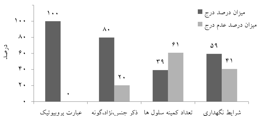
نمودار (۱) - مقایسه پروبیوتیک بودن فراورده‌های شیری و میزان درج جنس و گونه و تعداد کمینه سلول‌ها

در ادعای محصولات پروبیوتیک، علاوه بر اظهار کردن عبارت پروبیوتیک بودن محصول، باید جنس، گونه و نژاد آن‌ها، تعداد کمینه سلول‌های زنده پروبیوتیک برای هرگونه، به صورت جدا تا آخرین روز ماندگاری محصول برحسب CFU/g یا CFU/ml و شرایط مناسب نگهداری آن‌ها ذکر گردد. از بین