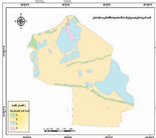
شکل ۲. گروه‌های هیدرولوژیکی خاک در محدوده پستکوه (نگارنده)

TM در سال ۱۹۸۲ ابداع گردید و انعکاس امواج مادون قرمز را از سطح زمین دریافت می‌کند و دارای ۷ باند است که اطلاعات بیشتری را نسبت به MSS نشان می‌دهد. بازه مورد استفاده توسط TM از وسط مادون قرمز است که توان جدا سازی فضایی آن ۳۰ متر است ETM+ در سال ۲۰۰۰ ساخته شد و شبیه به TM می‌باشد و تنها تفاوت آن، این است که دارای باند پانکروماتیک نیز است که قدرت تفکیک فضایی آن