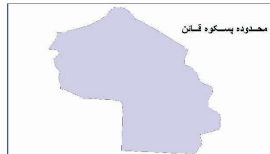
شکل ۱. موقعیت محدوده پستکوه در کشور و استان