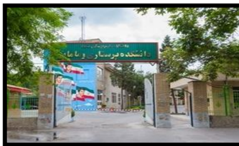
تصویر ۱. از راست به چپ- نمایی از دانشکده پرستاری و مامایی مشهد و دانشکده ادبیات و علوم انسانی دانشگاه فردوسی مشهد