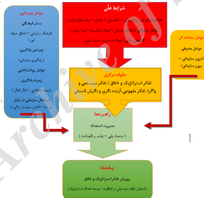
شکل ۱. مدل پارادایمی به دست آمده از بخش کیفی " طراحی مدل پرورش تفکر استراتژیک و خلاق در شرکت ملی نفت ایران "