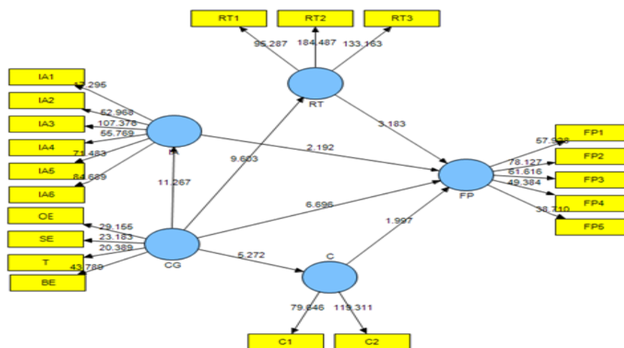
شکل ۳: مدل مفهومی تحقیق همراه با ضرایب معناداری (T-values)

مدل‌های معادلات ساختاری به‌طور معمول ترکیبی از مدل‌های اندازه‌گیری (نشان‌دهنده زیر مؤلفه‌های متغیرهای مکنون) و مدل‌های ساختاری (نشان‌دهنده روابط بین متغیرهای مستقل و وابسته) هستند.