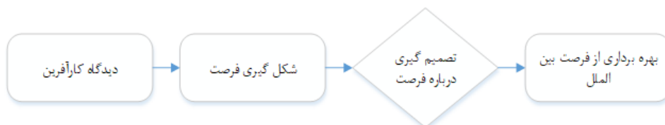
شکل ۲: رویکرد فرصت محور به بهره‌برداری از فعالیت‌های کارآفرینی (اقتباس از اویسونو و یتاگر، ۲۰۱۰)

- رویکرد فرصت محور به کارآفرینی بین‌الملل نیاز به درک بهتری از کارآفرینی در کارآفرینی بین‌الملل و نقش فرصت در کارآفرینی بین‌الملل وجود دارد. در واقع نقش فرصت در روند بین‌المللی توسعه نیافته است. این بعد در کارآفرینی بین‌المللی مورد غفلت قرار گرفته است. نگاه افکندن به بین‌المللی سازی به عنوان دنبال نمودن فرصت‌های کارآفرینانه نشان می‌دهد که این مکان فرصت است که تعیین کننده انتخاب بهره‌برداری فرصت در بازارهای خارجی و بین‌المللی است. در رویکرد فرصت محور استفاده از دیدگاه کارآفرین که به فرصت‌های کارآفرینانه شکل می‌دهد و درباره بهره‌برداری از آنها تصمیم می‌گیرد عامل مهمی است. این رویکرد به شرح شکل ۲ است.