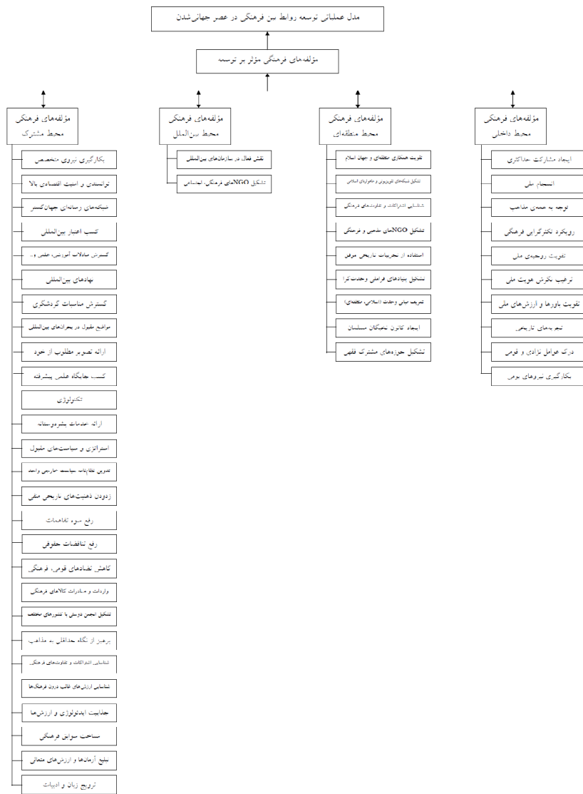
شکل ۲. مدل عملیاتی توسعه روابط بین فرهنگی در عصر جهانی شدن