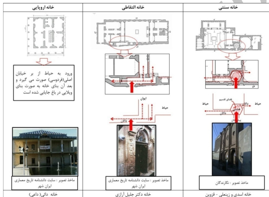
جدول ۷. مقایسه روند تغییر ورودی در خانه‌های قاجاریه قزوین

دوره قبل از ناصری - ناصری و بعد از ناصری شکل گرفتند. گاه در یک دوره می‌توان هر سه سبک را مشاهده کرد. به همین دلیل ۱۰ نمونه از خانه‌های شهر قزوین به‌منظور بررسی تغییر الگوهای محرمیت در راستای تغییرات فرهنگی مورد بررسی و تحلیل قرار گرفته‌اند (۵ نمونه شاهد در مقاله آورده شده است).