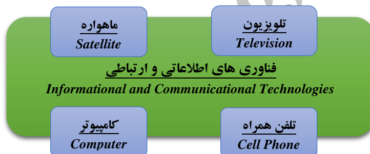
شکل ۱: فناوری‌های اطلاعاتی و ارتباطی