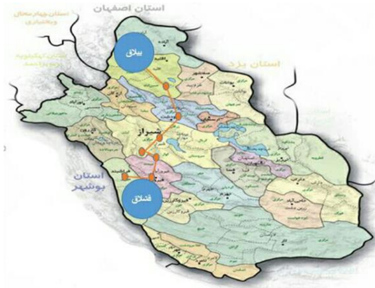
شکل (۱): موقعیت نسبی قلمرو ایل قشقایی - تیره هیبت لو

در قلمروها، از دیرباز مورد توجه گردشگران و علاقمندان به حفظ طبیعت بوده است. شکل شماره ۱ موقعیت جغرافیایی منطقه‌ی مورد مطالعه را نشان می‌دهد.