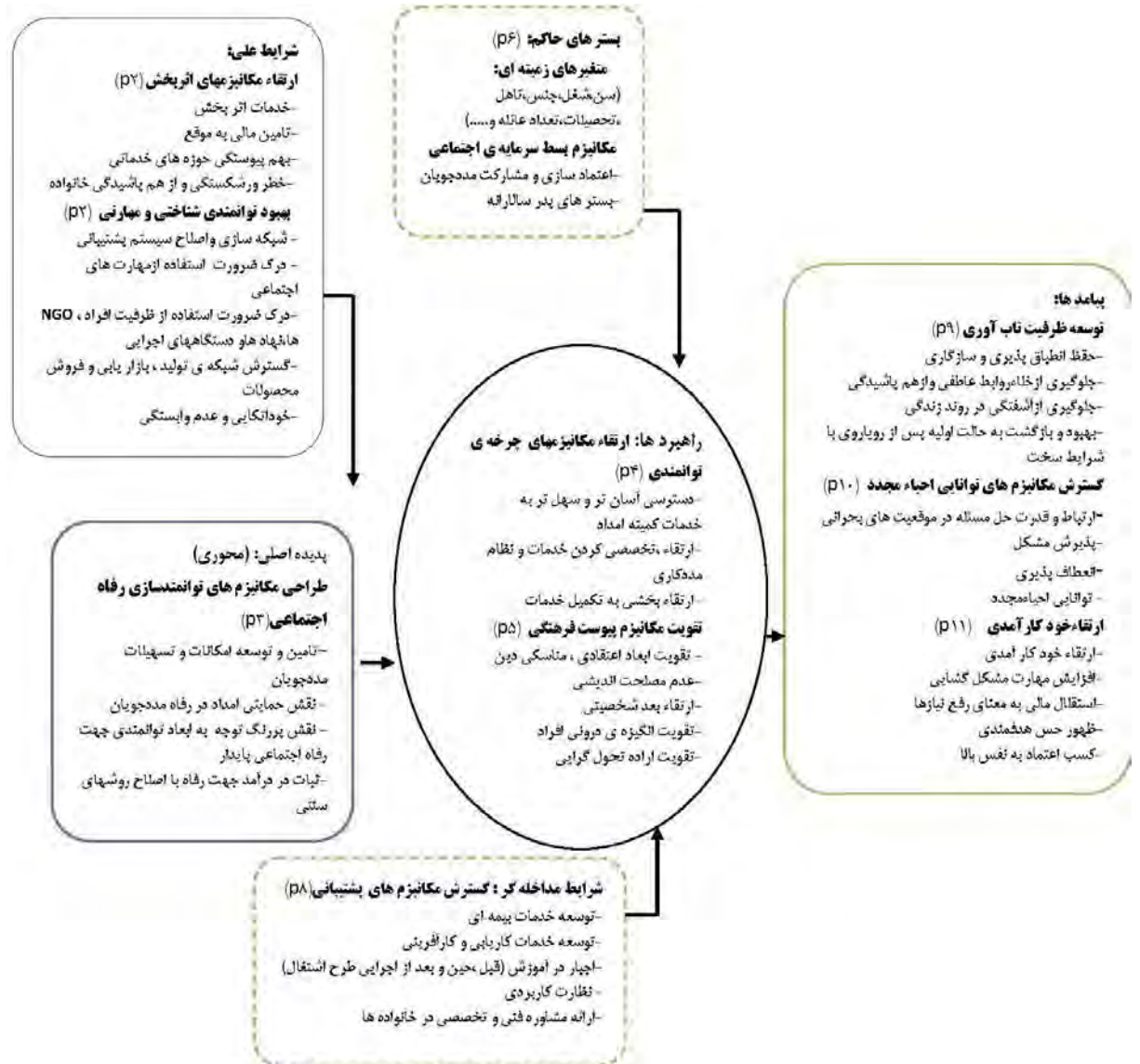
نمودار (۲): کدگذاری محوری بر اساس مدل پارادایم