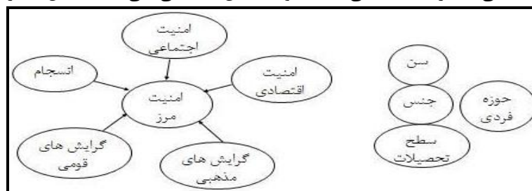
شکل ۲- مدل مفهومی تحقیق

روش تحقیق این پژوهش از نوع توصیفی - تحلیلی است و جهت جمع‌آوری داده‌ها و اطلاعات از دو شیوه اسنادی و میدانی بهره گرفته شده است و با استفاده از پرسشنامه محقق ساخته داده‌های مورد نیاز گردآوری شد. پایایی آن نیز بر اساس روش اندازه‌گیری آلفای کرونباخ برابر با ۰/۸۴۱ محاسبه شد که مطلوب بحساب می‌آید. جامعه آماری ۲۶۰۱۰ خانوار و جامعه‌ی نمونه بر اساس فرمول کوکران ۳۸۰ خانوار انتخاب گردیده است. برای جمع‌آوری اطلاعات از شیوه‌های جاری همانند اطلاع‌یابی از طریق ریش سفیدان، شوراها، دهیاران و معتمدان روستا بدون اینکه زمینه جریحه‌دار شدن احساسات را فراهم نماید، بهره گرفته شده است. برای سنجش انسجام اجتماعی از سه شاخص ۱- گرایش شیعه و سنی منطقه به یکدیگر ۲- میزان تعامل اجتماعی آنها با یکدیگر ۳- میزان نزاع‌های جمعی میان آنها استفاده گردیده است. متغیرهای مورد بررسی در تحقیق شامل؛ داشتن فامیل نزدیک (پدر، مادر، خواهر، برادر، همسر)، تعلق مکانی، تعامل مذهبی - قومی، بیگانه نبودن، رضایتمندی، آسودگی خاطر، انسجام اجتماعی، مشارکت اجتماعی، اعتماد و اطمینان اجتماعی، می‌باشد. (شکل شماره ۱).