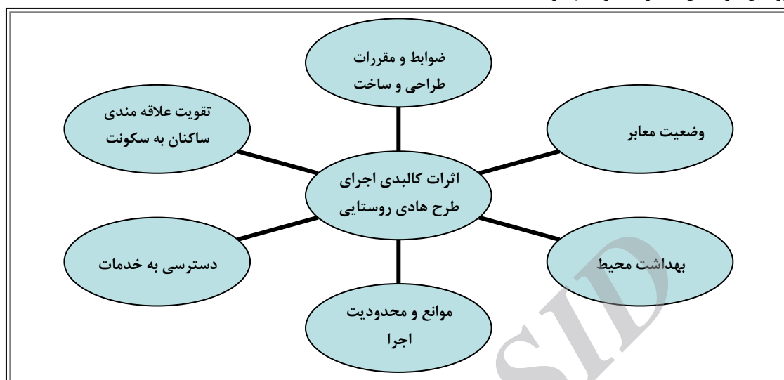
شکل ۱- مدل مفهومی پژوهش

(ناطق پور و همکاران، ۱۳۸۳: ۲۴). یکی از طرح‌های توسعه فیزیکی طرح هادی روستایی است که در مسیر برنامه‌ریزی‌های توسعه روستایی بعد از پیروزی انقلاب اسلامی مورد توجه قرار گرفته است. بر اساس این طبقه بندی، چارچوب/ مدل مفهومی پژوهش در شکل شماره ۱ ترسیم گردید.