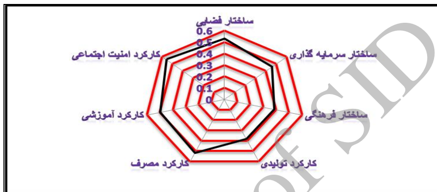
نمودار ۱- نمودار راداری رتبه‌ی شاخص‌های حاصل از ساختار و کارکرد شهری بر کیفیت شهرنشینی