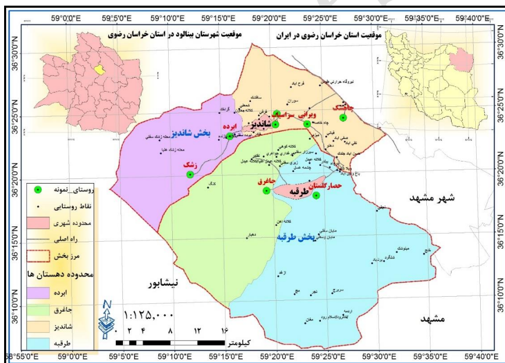
شکل ۱- موقعیت منطقه مورد مطالعه