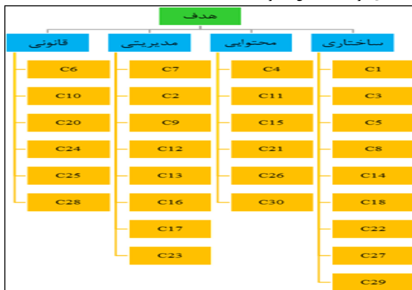
شکل ۱- خوشه بندی معیارهای مورد بررسی در نرم افزار Super Decision - مأخذ: مطالعات نگارندگان، ۱۳۹۶.

مؤلفه های تأثیر بیشتری دارند از مدل ANP استفاده شد. در ابتدا معیارهای اصلی و زیرمعیارها مؤثر در بازدارندگی تحقق طرح های آمایشی دسته بندی گردیدند. (شکل شماره ۱).