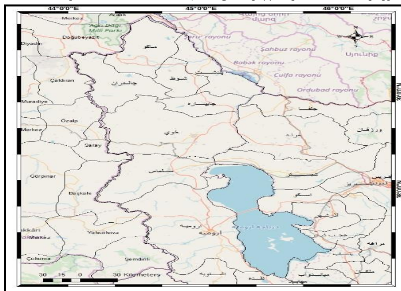
شکل ۱- استان آذربایجان غربی و استان های شرقی کشور ترکیه دارای مرز مشترک با کشور ایران

مساحت منطقه موردنظر مطالعه (دو بخش ایران و ترکیه)، حدود ۹۲۷۰۰ کیلومترمربع است. منطقه موردنظر مطالعه حاضر مانند جزیره ای است که توسط دو دریاچه وان (در کشور ترکیه) و دریاچه ارومیه (در کشور ایران) احاطه شده است. مناطق موردنظر این مطالعه با توجه به دارا بودن پیشینه ای تاریخی و حتی مشترک، پتانسیل های اکو توریسم و گردشگری و سایر منابع و پتانسیل های جغرافیایی می توانند در توسعه و پیشرفت های همدیگر در آینده بسیار مؤثر باشند. منطقه موردنظر این مطالعه بخشی از شرق کشور ترکیه است که دارای چهار استان به نام های Ağrı, Iğdır, Van و Hakkari است. (شکل ۱).