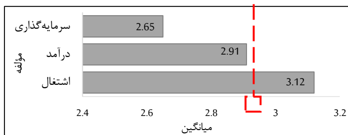
شکل ۳- میانگین مؤلفه‌های ارزیابی اثرات اقتصادی اجرای طرح های روستایی

با توجه به یافته‌های جدول شماره ۴، مقدار آماره T برای بعد اقتصادی در روستاها، برابر با -۳/۲۰ و مقدار سطح معناداری ۰/۰۰ که از ۰/۰۵ کمتر است و با توجه به میانگین مربوط به آن، که کمتر از ۳ است (عدد ۳ به عنوان میانه نظری ارزیابی آثار اقتصادی طرح هادی بر مؤلفه‌های تحقیق، مورد توجه بوده است)، با اطمینان ۹۵٪ نتایج آزمون حاکی از آن است که ارزیابی میانگین وزنی اثرات اقتصادی اجرای طرح هادی در محدوده مورد مطالعه با میانگین ۲/۸۹ مبین پایین بودن میزان عملکرد و تأثیر این طرح از حد متوسط (عدد ۳) بوده، لذا اجرای این طرح از نظر ماهیت اقتصادی موفقیت‌آمیز نبوده است.