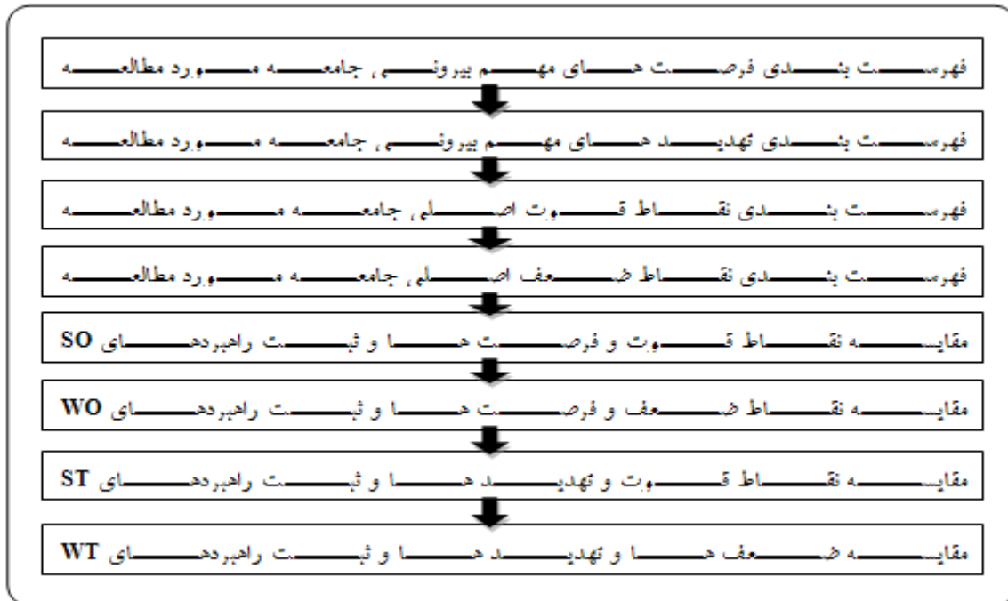
شکل شماره ۱- نمودار مراحل تهیه مدل سوات

۴۰). این تکنیک شامل یک فرآیند ۸ مرحله ای می باشد، که در نمودار ۱-۴ ارائه شده است.