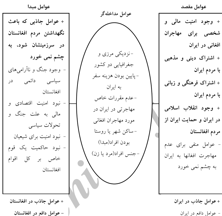
شکل شماره ۲- نمودار عوامل موثر در جذب و دفع مهاجران افغانی

مهاجرت؛ ۲- وجود مشکلات و دافعه‌ها در جامعه مبدأ؛ ۳- وجود جاذبه‌ها در جامعه مقصد، به نظر می‌رسد که از میان انواع نظریات ارائه شده در مورد پدیده مهاجرت، نظریه جذب و دفع قابلیت تطبیق بیشتری با این مهاجرت دارد (جمشیدیها، ۱۳۸۱: ۷۲).