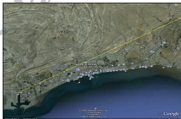
شکل ۱- موقعیت شهر بندرعباس بر روی نقشه و تصاویر ماهواره‌ای

( www.googleearth.com و سازمان جغرافیایی نیروهای مسلح، ۱۳۸۹)