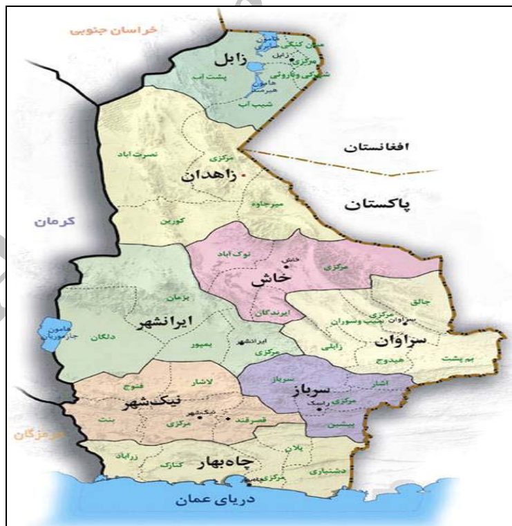
شکل ۲- موقعیت مرزی استان سیستان و بلوچستان