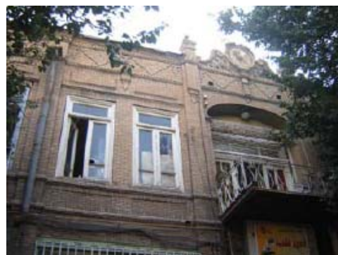
شکل ۱۳- جداره‌های شهری متعلق به دوره پهلوی (تبریز)، عناصر ارزشمند هویت‌بخش و کیفیت‌زا در معماری جداره‌های شهری، عمیقاً نیازمند حفاظت هستند.

ویژگی‌های فوق را می‌توان در یک عبارت خلاصه نمود و آن اینکه توجه به آرایه‌های معماری شهری