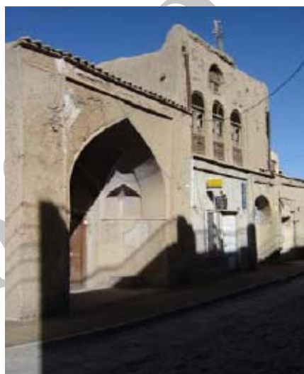
شکل ۱۷- کوچه سنگ‌تراشها (اصفهان)، اجزای شکل دهنده به معماری جداره‌های فضای شهری اعم از روزنه‌ها و بازشوها، سردر ورودی، خطوط ناظم، رخ‌بامها و...

بدنه‌سازی‌ها، قاب‌بندی‌ها، تاقنماها، آرایه‌های روی بدنه (کاشیکاری، شمشه‌گیری و اندودکاری، معقلی و نقوش آجرکاری، شبکه‌چینی، مقرنس‌کاری، جزئیات سنگی و...) گوشه‌ها و نبش‌ها (آجرکاری، اندودکاری و...) رخ‌بام‌ها (آجری، سنگی، فلزی و...) و خطوط لبه بام‌ها (آجرچینی، شرفی‌چینی، شبکه‌چینی و...)