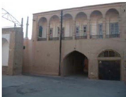
شکل ۷- خانه‌ای بر روی ساباط (میدان وقت‌الساعه در یزد)، توجه به کیفیات معماری شهری، هم در مقیاس فضا و هیأت کلی ابنیه (کالبد) و هم در مقیاس عناصر سازنده جداره و تزئینات

معماری شهری به نوبه خود دارای دو ساحت کلان «فضایی» و «کالبدی» است که بطور عمیق با «فعالیت»ها و «رفتار»های انسانی در هم آمیخته و معنا یافته است؛ هرچند نمی‌توان ساحت‌های فضایی، کالبدی و رفتاری را بطور کاملاً متمایزی از یکدیگر تفکیک نمود. بطور غالب و معمول، مؤلفه‌ها و اجزای کالبدی شکل‌دهنده و مؤثر در معماری فضاهای شهری عبارتند از: بدنه‌ها، کف‌ها، سقف‌ها و اجزای الحاقی (نظیر مبلمان شهری، تأسیسات و...). آنچه ما از آن به تزئینات معماری شهری تعبیر می‌کنیم، اجزایی هستند