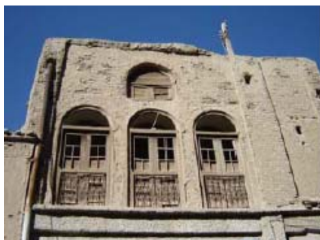
شکل ۱۹- کوچه سنگ‌تراشها (اصفهان)، جایگاه روزنه‌ها و بازشوها در معماری جداره‌ها