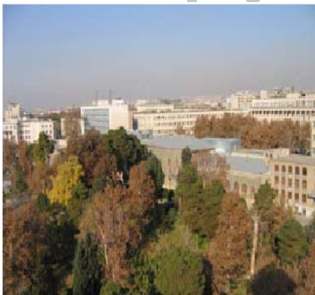
شکل ۳- کاخ شمس‌العماره در مجاورت بافت جدید تهران، مخدوش شدن آن در گسترش ساخت و سازهای جدید و ناهماهنگ

اتحاد درونی به گونه‌ای بوده است که آثار بر جای مانده از تعامل آنها با یکدیگر، این تصور را در ذهن مخاطب ایجاد می‌کند که گویی کل اثر، محصول کار هنرمندی واحد است.