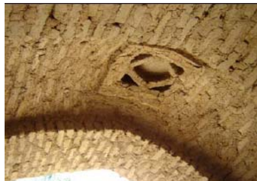
شکل ۸- بافت تاریخی سکونتگاه‌های حاشیه‌زاینده رود در استان چهارمحال و بختیاری (کوهستانی)، نقشمایه‌های معماری شهری هم در مقیاس کلان و هم در مقیاس خرد، نقش مؤثری در کیفیت‌زایی و هویت‌بخشی فضاها و جداره‌های شهری دارند.

برونگرایی می‌باشد. ۱ این الگوهای فضایی غالباً بستر مساعدی برای بروز پاره‌ای موتیف‌ها و تزئینات شهری نیز گردیده‌اند که از جمله آنها می‌توان به انواع شبکه‌سازیها، فرورژه‌های فلزی، روزنه‌ها و بازشوها، ستونها و سرستونها و انواع طاقهای تزئینی اشاره نمود.