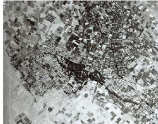
شکل ۱- بافت تاریخی شهر مهریز در عکس هوایی سال ۱۳۳۵ ه.ش، بافت‌های سنتی تجلی وحدت و انسجام در عین کثرت و گونه‌گونی

اتحاد درونی به گونه‌ای بوده است که آثار بر جای مانده از تعامل آنها با یکدیگر، این تصور را در ذهن مخاطب ایجاد می‌کند که گویی کل اثر، محصول کار هنرمندی واحد است.