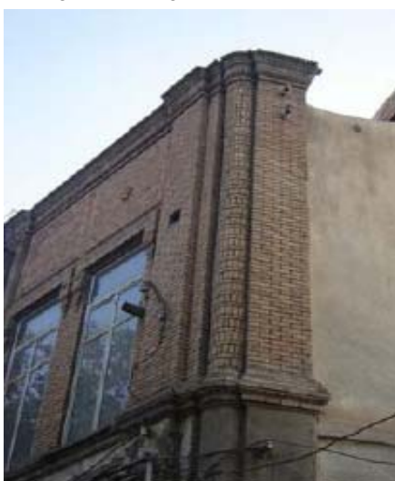
شکل ۱۱- نیش کوچه در خیابان تربیت تبریز. توجه ویژه به معماری جداره‌ها خصوصاً در تعریف نیش‌ها و نقاط گردش معابر

بر این مبنای، نقشمایه‌های تزئینی معماری شهری از دو جهت دارای اهمیت و ضرورت حفاظت هستند؛ یکی به جهت قدمت، ریشه‌داری و هویت‌بخشی به بدنه‌ها و فضاها و کهن شهری و دیگری بخاطر کیفیت‌زایی و به تبع آن، الهام‌بخشی آنها در بازتعریف کیفیت‌ها و الگوهای معماری شهری امروز، خواه متصل به بافت‌های تاریخی و خواه منفصل از آنها.