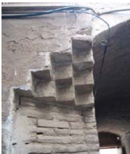
شکل ۱۰- نیش کوچه در بافت تاریخی شهر اردکان (یزد). توجه ویژه به معماری جداره‌ها خصوصاً در تعریف نیش‌ها و نقاط گردش معابر