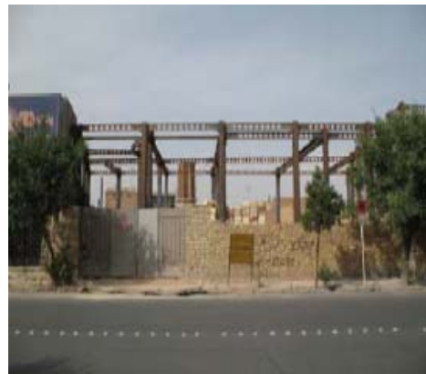
شکل ۲۶- دورنمای بادگیر (خیابان قیام یزد)، عناصر تاریخی معماری شهری توسط مستحذات و تغییرات جدید، شدیداً در معرض تهدید قرار دارند.