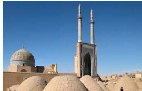
شکل ۲۷- دورنمای سردر ورودی و گنبدخانهٔ مسجد جامع یزد، اجزای اصیل معماری شهری بافت‌های تاریخی، الهام‌بخش در ساماندهی این بافتها و نیز تعریف و شکل‌دهی به بافتها و فضاهاى جدید شهری

موضوع نقشمایه‌ها و آرایه‌های معماری شهری، مقوله‌ای میان‌رشته‌ای ۵ و مشترک میان رشته‌های معماری، طراحی شهری و مرمت شهری است. در راستای تحقق آنچه در این مقاله ضرورت و اهمیت آن طرح گردیده، لازم است این موضوع جای خود را در عرصهٔ «آموزش» در رشته‌های یاد شده به طور