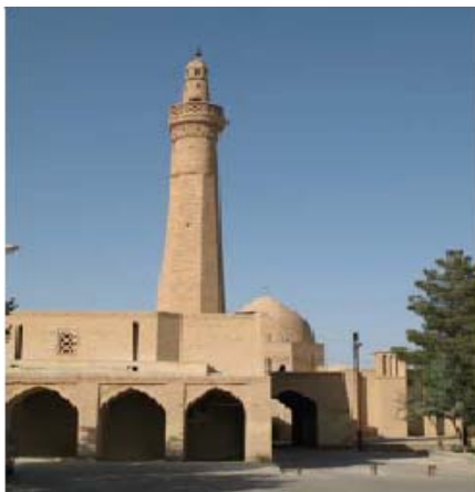
شکل ۲- ارسن تاریخی مسجد جامع نائین، وحدت و هماهنگی در بافتها و بناهای اصیل تاریخی

نوع بشر در زمان‌ها و مکان‌های مختلف برشمرد. به دلیل وجود قواعد نانوشته بین معماران و نیز وحدت عوالم ذهنی ایشان، علی‌رغم آنکه کسانی به عنوان «طراح شهری» جدا از معماران به طراحی و سامان بخشیدن به فضاهای شهری نپرداخته‌اند، لیکن منسجم‌ترین، هماهنگ‌ترین و به بیان عام، زیباترین فضاها و آثار معماری شهری را می‌توان در بافتهای تاریخی شهرها جستجو و مشاهده نمود که این امر در جای خود بسیار قابل تأمل خواهد بود.