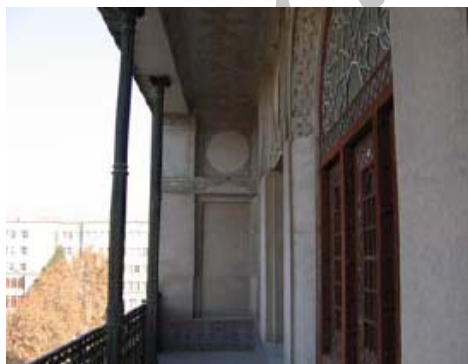
شکل ۱۵- بالکن‌های بالای ورودی‌ها و مشرف به فضای شهری (جداره متعلق به دوره پهلوی اول - تبریز)، الگوهای خاص فضایی مؤثر در کیفیات معماری شهری، به مثابه اجزای لاینفک معماری ابنیه و فضاهای شهری

«مأنوس‌سازی» فضای شهری برای افراد و ایجاد و القای «مقیاس انسانی» ۱ و ۱:۱ در تعریف و ادراک فضای شهری و توجه به حضور انسان (فرد پیاده) در فضاهای شهری در پرتو ایجاد معماری گرم و منعطف در بدنه‌ها و کف و پرهیز از فضاها و بدنه‌های صلب، زمخت و عاری از جزئیات؛ ایجاد قابلیت‌هایی برای «کنجکاوی»، «کشف» و «تماشا» در معماری فضا و بدنه‌های شهری؛