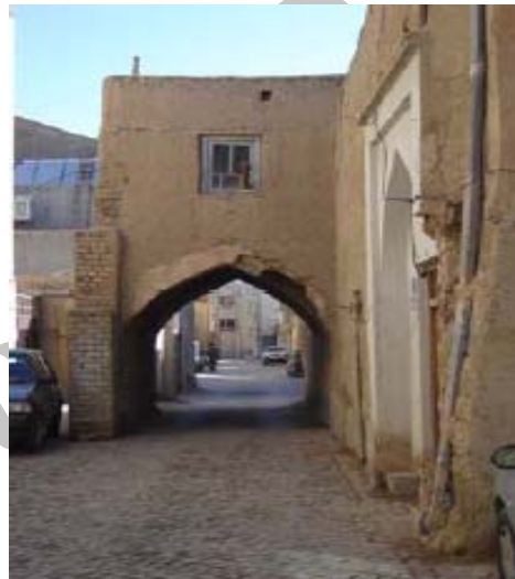
شکل ۲۵- ساباط در کوچه سنگ‌تراشها (اصفهان)، عناصر تاریخی معماری شهری توسط مستحذات و تغییرات جدید، شدیداً در معرض تهدید قرار دارند.

جایگزینی روزنه‌ها و بازشوهای اصیل با نمونه‌های فلزی جدید با هدف ایجاد امنیت و یا حذف عناصر فرسوده قدیمی بدون توجه با سابقه هویتی و تاریخی آنها؛ تخریب و یا در محاق قرار گرفتن عناصر و المانهای معماری و الگوهای ویژه فضایی تأثیرگذار در کیفیات معماری شهری؛