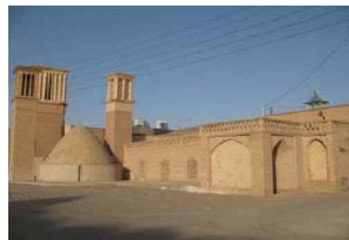
شکل ۹- بافت تاریخی شهر نائین (گرم و خشک)، نقشمایه‌های معماری شهری هم در مقیاس کلان و هم در مقیاس خرد، نقش مؤثری در کیفیت‌زایی و هویت‌بخشی فضاها و جداره‌های شهری دارند.