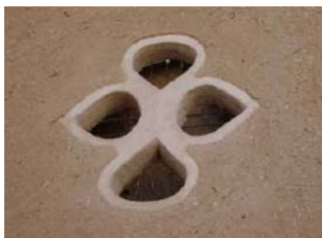
شکل ۱۸- دانشکده هنر ادیان و تمدنها، دانشگاه هنر اصفهان (خانه تاریخی)، جایگاه روزنه‌ها و بازشوها در معماری جداره‌ها

روزنه‌ها و بازشوها، درها، پنجره‌ها، نورگیرها، شبکه‌ها (فلزی، گچی، چوبی، آجری، کاشی و...)، نودانها (فلزی، آجری، سنگی، چوبی، کاشی) و سایر عناصر تأسیساتی نورپردازی، چراغ‌ها و انواع منابع روشنایی بدنه‌ها نرده‌ها و دست‌اندازها (چوبی، فلزی، آجری، کاشی و...) (و...)