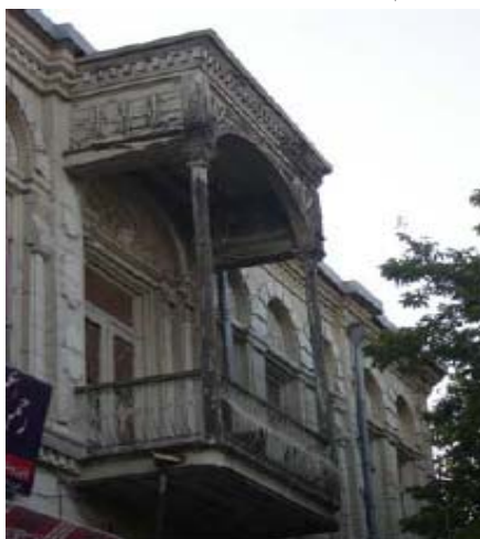
شکل ۱۴- ایوان‌های مشرف به فضای شهری (کاخ شمس‌العماره - تهران)، الگوهای خاص فضایی مؤثر در کیفیات معماری شهری، به مثابه اجزای لاینفک معماری ابنیه و فضاهای شهری

موجب تعریف متفاوتی از «شهر به مثابه خانه» ۲ خواهد گردید که به نظر می‌رسد با تلقی‌ای که امروز از شهرهای ما موجود است، بسیار متفاوت باشد. اگر چنین نگرشی بر شکل‌گیری معماری شهری حاکم نباشد، اصولاً نقشمایه‌ها و آرایه‌های معماری شهری نیز جایگاهی نخواهند داشت و دانه‌های معماری - به ناگزیر - با چهره‌ای خنثی و بی‌تفاوت، فضاهای شهری را رقم خواهند زد.