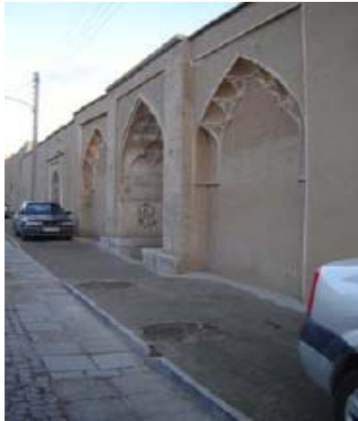
شکل ۲۰- سردرهای ورودی، رواق، ایوان و بالکن‌ها در محله تاریخی جلفای اصفهان، عناصر معماری و الگوهای فضایی تأثیرگذار در هویت معماری شهری و کیفیات فضای شهری