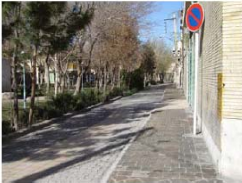
شکل ۱۶- کفسازی صورت گرفته در بافت قدیم محله جلفای اصفهان، اهمیت کفسازی و عناصر معماری محوطه در کیفیت بخشی به فضای شهری

معاير و فضاهای شهری گردند. هندسه و جزئیاتی که وابسته به دیگر عناصر سازنده کف و محوطه هستند از قبیل باغچه‌ها، حوض‌ها، آبنماها و مسیرهای حرکت آب نیز در شکل‌گیری معماری کف و محوطه فضاهای شهری، نقش بسزایی دارند که به نوبه خود دارای زیبایی و کارکردهای ویژه خود هستند.