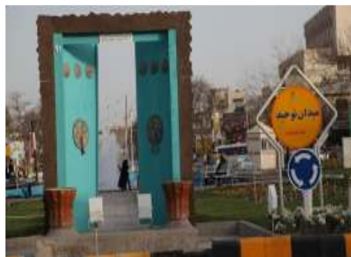
تصویر شماره ۹: المان موج و کشتی

تحلیل اولیه المان: این المان در مکان دروازه سابق مشهد به نام دروازه قوچان قرار گرفته است و از نقاط پر رفت و آمد زائرین به حساب می‌آید. پیام این المان به صورت غیر مستقیم اشاره به احترام زائران و مجاوران در ورود به حریم مقدسی حرم مطهر دارد و از این بابت اذن ورود و دخول طلبیده می‌شود و در این المان در به روی زائران گشوده شده است. تداعی این اثر، خاطره فردی است که به هنگام ورود به هر خانه، رد شدن از در و اجازه ورود خواستن می‌باشد. تحلیل نهایی المان: به کارگیری این المان در یکی از نقاط ورودی شهر و معنای ضمنی آن بسیار خوب و مثبت ارزیابی می‌شود با این حال به نظر می‌رسد رعایت دو مورد می‌توانست به بالندگی این اثر بیشتر بیافزاید. نخست منظره‌ای که پس از باز شدن در به چشم می‌خورد می‌توانست پیامی مستقیم و یا غیر مستقیم از وجود امام هشتم و بارگاه ایشان را به تصویر کشد و در قسمت دوم با گسترش فضاهای بسته (به طور مثال دیوار مانند) در هر دو سمت در ورودی، وقتی در باز باشد، دید بیشتری را به خود جذب می‌کند.