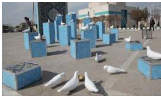
تصویر شماره ۳: المان آب و دون

و کبوتران حرم برایش زنده می‌شود و از این نظر به کارگیری این المان و مشابه آن در محیط شهر مشهد مثبت ارزیابی می‌شود.