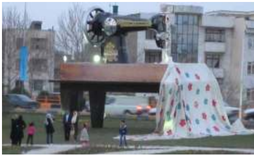
تصویر شماره ۱: المان یادگار مادر بزرگ