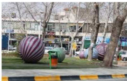
تصویر شماره ۴: المان بریم گل کوچک

تحلیل نهایی المان: این المان اشاره خاصی به فرهنگ و هویت شهر اسلامی مشهد نمی‌کند و بیانگر بخشی از فرهنگ عمومی مردم است. از این جهت شکل-گیری تصویر ذهنی بر اساس این المان از شهر مشهد، به گونه‌ای که ناظر وقتی بدان نگاه می‌کند، یاد خاطرات گذشته او برایش زنده شود، و از این نظر به کارگیری این المان و مشابه آن در محیط شهری کم رفت و آمد مثبت ارزیابی می‌شود.