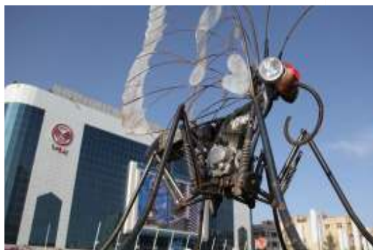
تصویر شماره ۵: المان تولدی دیگر

تحلیل نهایی المان: این المان اشاره خاصی به فرهنگ شهر اسلامی مشهد نمی‌کند مگر آن که فرافکنی کرده و معنای «تولد دیگر» را که دستاورد زیارت امام هشتم شیعیان می‌تواند باشد به این المان نسبت دهیم. با این حال برقراری این گونه ارتباط در ذهن ناظر به نظر دور می‌رسد. تصویر ذهنی بر اساس این المان از شهر مشهد، به گونه‌ای است که ناظر وقتی به یاد این المان بیفتد و یاد ترکیب نامانوس پروانه بعنوان یک موجود زنده و موتور سیکلت بعنوان مصنوع ساخت دست بشر برایش زنده شود، نه تنها برای او پیام و دستاوردی معنوی ندارد بلکه او را گاهاً به تفکر درباره این ترکیب نامانوس وا می‌دارد و از این نظر به کارگیری این المان و مشابه آن در محیط شهری شهر مشهد منفی ارزیابی می‌شود.