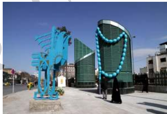
تصویر شماره ۸: المان پرنده نقارچی

تحلیل نهایی المان: نکته قابل توجه استفاده از این المان‌ها با مرجع تذکر اسلامی در یکی از پر رفت و آمدترین محل‌های تردد زائرین است که می‌تواند پیام خود را به زائرین بیشتری برساند با این وجود استفاده از یک تسمیح بزرگ مقیاس، به دور از ذوق هنری، ساده‌ترین شیوه انتقال پیام است که در آن ارزش‌های هنری یافت نمی‌شود، در واقع استفاده از المان‌هایی با پیام‌های مذهبی که فرد را تا حدودی به فکر فرو ببرد به نظر بهتر می‌باشد.