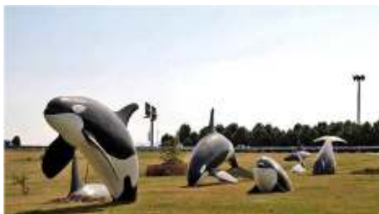
تصویر شماره ۶: المان کوچ نهنگ‌ها

است، بیشتر یاد شهرهای توریستی را به دنبال دارد تا شهری زیارتی.