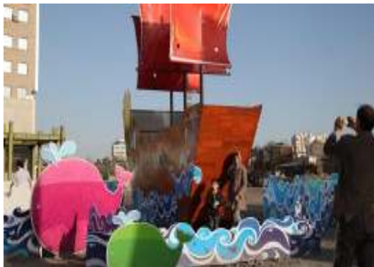
تصویر شماره ۹: المان موج و کشتی

تحلیل نهایی المان: قصد و هدف طراح و مدیر شهری از استفاده از این المان در یکی از تقاطع‌های پر رفت و آمد زائران و مجاوران به وضوح روشن نیست و در واقع هیچ‌گونه ارتباطی میان به کارگیری این المان با زمینه فرهنگی و مذهبی شهر مشهد برقرار نمی‌شود و از این نظر استفاده از این المان منفی ارزیابی می‌شود.