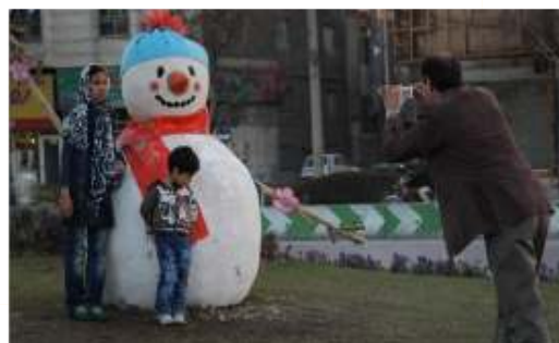
تصویر شماره ۲: المان سفر آدم برفی

اشاره می کند. ابعاد و اندازه آن در حد مقیاس انسانی است و درک المان از فاصله نزدیک میسر است. مکان قرارگیری المان در نقطه ای پر رفت و آمد بوده و در نتیجه پیام خود را به طیف گسترده ای ارائه می کند. تحلیل نهایی المان: با توجه به اینکه این المان در میدان راه آهن به عنوان یکی از مهمترین مبادی ورود زائرین حضرت علی بن موسی الرضا (ع) قرار گرفته بررسی و ارزیابی آن حائز اهمیت بسیار است، در واقع زائر در بدو ورود به جای اینکه پیامی با محوریت مذهب دریافت نماید به او پیام داده می شود که زمستان پایان پذیرفته است و در هنگام خروج از مشهد هم آخرین المانی است که مشاهده می کند که یکی از آخرین پیام هایی است که از شهر مشهد به سوغات می برد و این همان تهدیدی است که رفته رفته باعث تغییر تصور ذهنی او از شهر مشهد می گردد و از این نظر به کارگیری این المان و مشابه آن در محیط شهری شهر مشهد و به خصوص در این مکان منفی ارزیابی می شود.