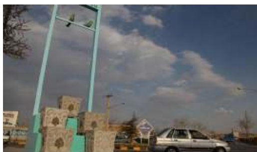
تصویر شماره ۷: المان پله‌ها